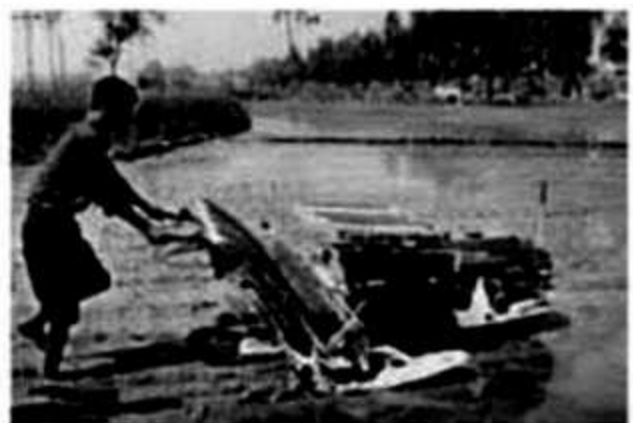
B. শিল্পনির্ভর কৃষি