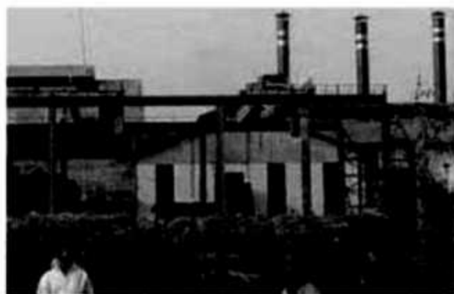
A. কৃষিনির্ভর শিল্প (চিনি শিল্প)